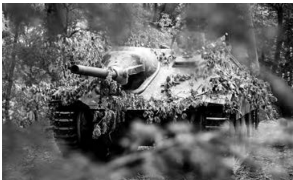
Bijgaande foto is van een zgn. Jagdpanzer 38(t), die speciaal voor het evenement uit Engeland overkwam.

Het museumpark mag dan langzamerhand een maatje te klein aan het worden zijn, het lommerrijke karakter gaf wel een heel eigen groene kleur aan het geheel. Kortom, verhuizen is geen optie. Voorlopig zal Militracks dus nog wel een paar jaar in Overloon blijven.