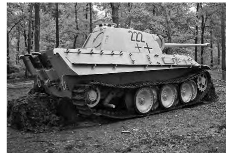
De Duitse tank die achterbleef in Overloon en tegenwoordig in het museum te zien is.

Het Facebook-bericht vindt u hier: https://www.facebook.com/events/1507254065981241/ .