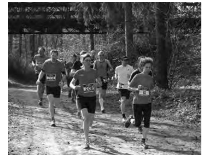
Onder bruggen door, langs tanks, Schaartven en uitkijktoren!

De Kleffenloop start bij sporthal De Raaijhal aan de Raaijweg 15 in Overloon. Er is voldoende kleed- en doucheruimte aanwezig. Voor alle jeugddeelnemers is