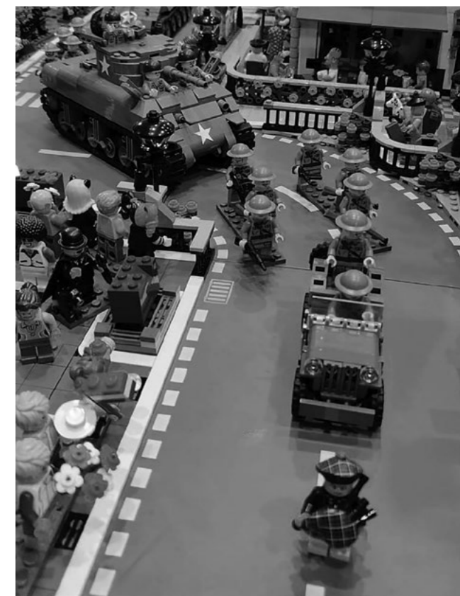
Een deel van het defilé

Via deze weg wil Dutchbricks iedereen die een steentje bij heeft gedragen aan het evenement en alle bezoekers heel hartelijk bedanken! We hebben zelfs mensen uit Zürich, Zwitserland, mogen ontvangen.