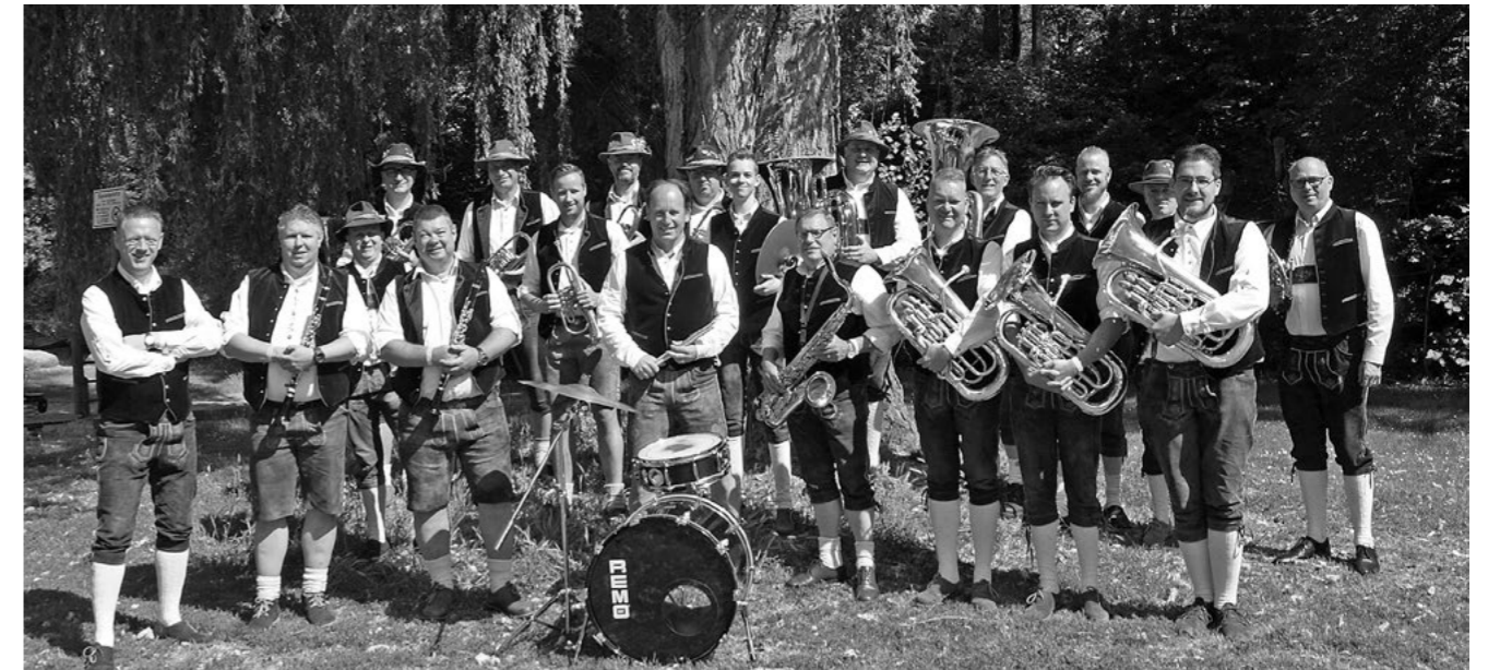
Die Eiserbach Muzikanten