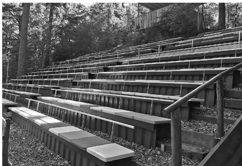
De gerenoveerde tribune met rugleuningen.

Kaarten voor de voorstellingen zijn verkrijgbaar bij Plus Verbeeten Overloon, bij restaurant Museumzicht en via de website www.openluchttheateroverloon.nl . Mocht het weer tegenzitten, dan gaan de voorstellingen gewoon door in 'de Pit'. Tot slot nog een tip: like ons op Facebook, www.facebook.com/openluchttheateroverloon . Regelmatig zijn er acties waarmee je kaartjes kunt winnen!